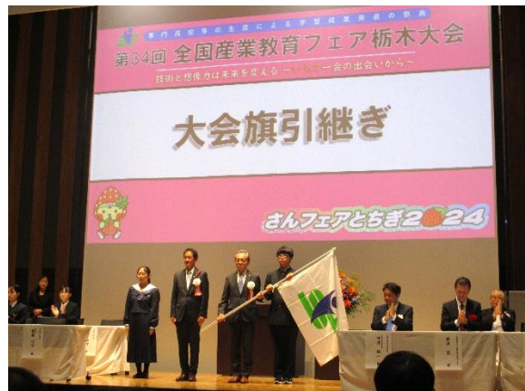
第34回栃木大会 総合閉会式での大会旗引継ぎ (福島県教育委員会教育長と生徒実行委員会委員長)