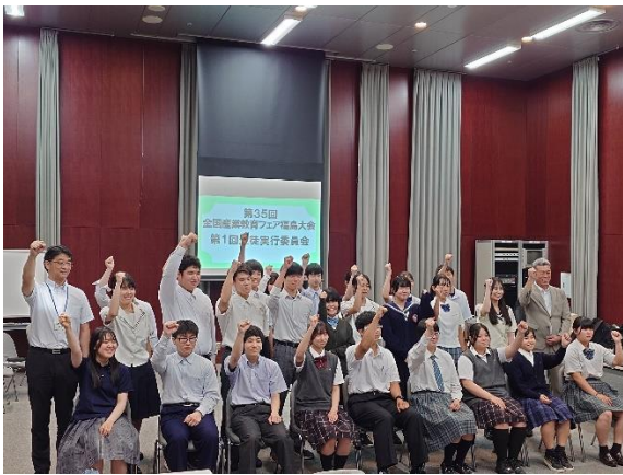
福島県生徒実行委員会