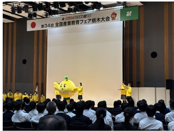
福島県生徒実行委員会による 第34回栃木大会参加交流イベントでのPR活動